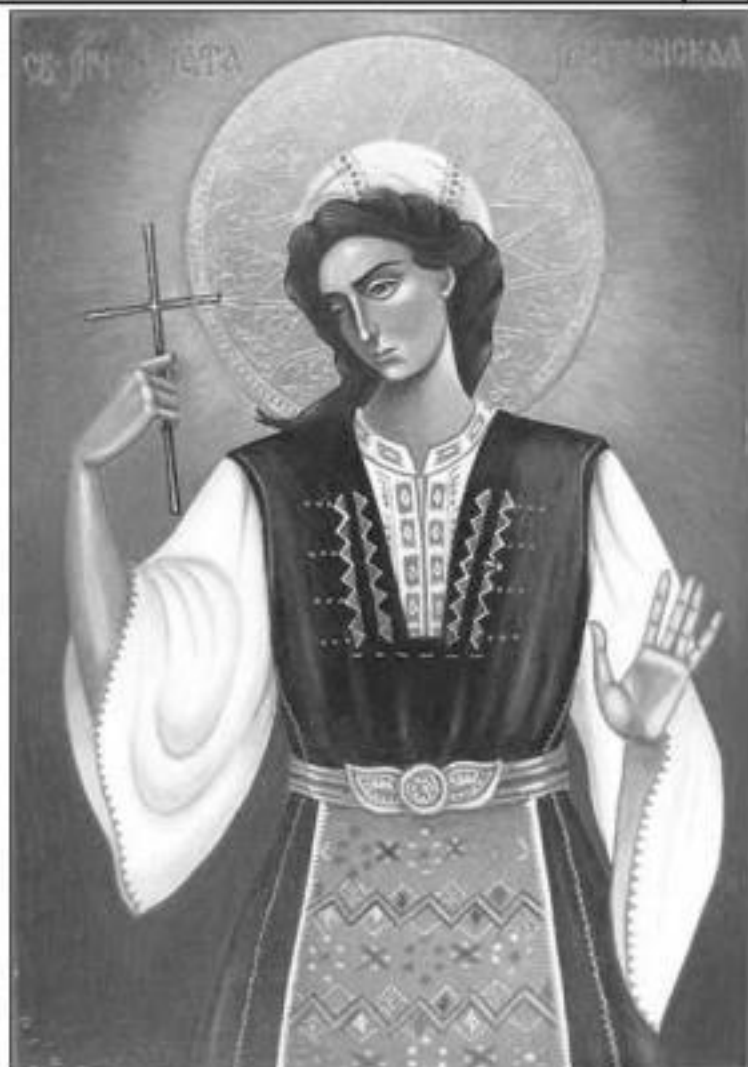
Великомъченица Злата Мъгленска