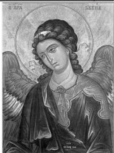
Свети архангел Гавриил