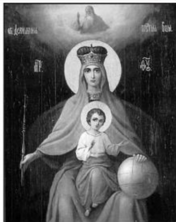
Икона на Пресвета Богородица "Държавна"