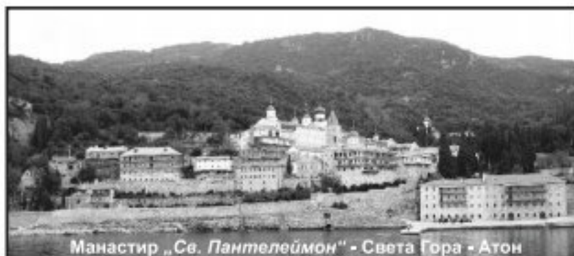
Манастир „Св. Пантелеймон“ - Света Гора - Атон