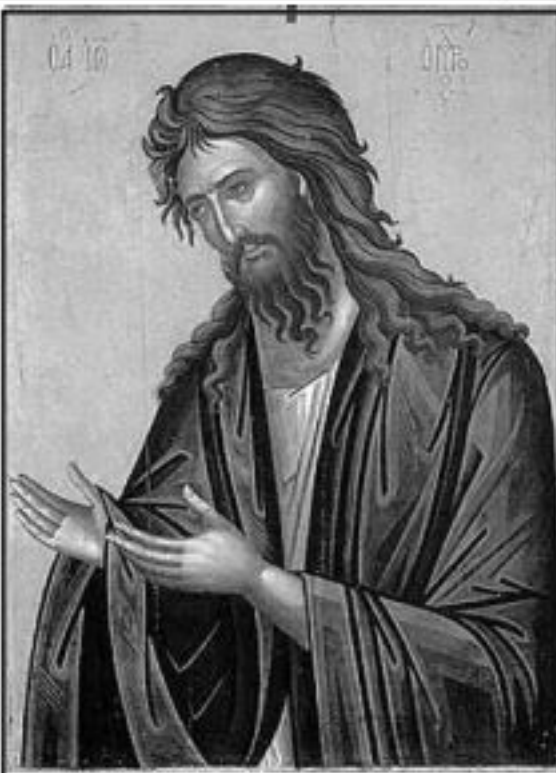
Свети Йоан Предтеча, Кръстител Господен