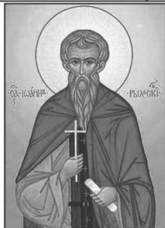
Свети Йоан Рилски Чудотворец